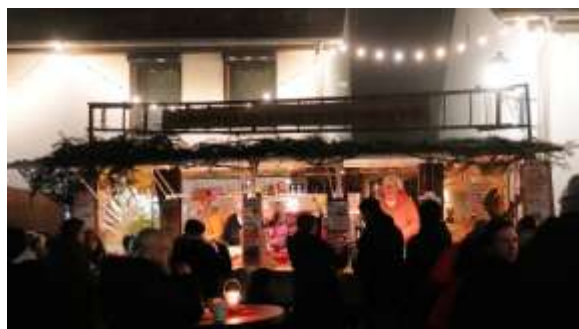
Der Samstagabend war wieder mal der Renner